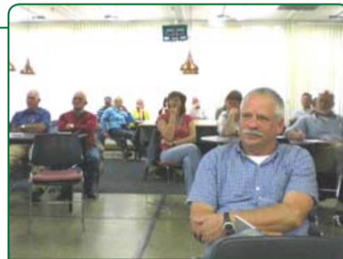
Bewoners luisteren geïnteresseerd naar de plannen.

"Nu de financiën rond zijn voor het wijkcentrum kunnen we echt aan de slag. Het plein is ook belangrijk. In veel ontwikkelingen wordt alleen gekeken naar het gebouw en het geld dat daar voor nodig is. De inrichting van de ruimte rond de gebouwen verdient zeker zoveel aandacht. Het zou zo leuk zijn als je met elkaar lekker op een terras kunt gaan zitten. Ik denk ook aan leuke speelmogelijkheden voor kinderen. Zo wordt het een plein waar iedereen even makkelijk verblijft. Even